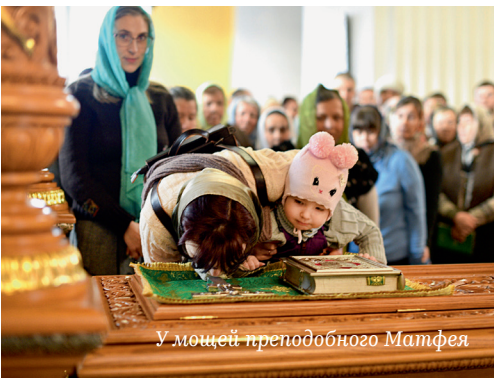
У мощей преподобного Матфея