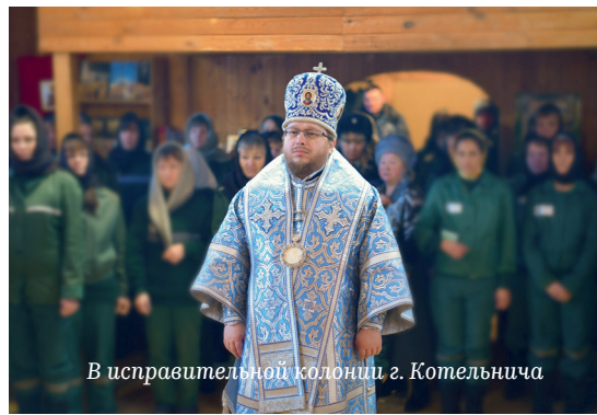
В исправительной колонии г. Котельнича