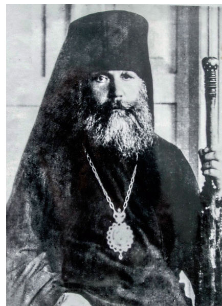
Архиепископ Пахомий (Кедров)

В 1925 году он арестован в Москве по делу так называемого «Даниловского синода», который возглавлял архиепископ Феодор (Поздеевский). 21 мая 1926 года Особое Совещание при коллегии ОГПУ приговорило архиепископа Пахомия к трехгодичной ссылке в Зырянский край.