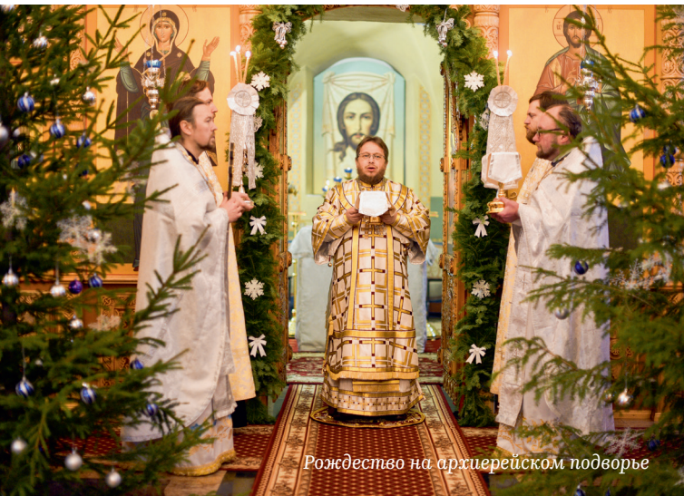
Рождество на архиерейском подворье