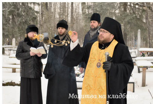
Молитва на кладбище