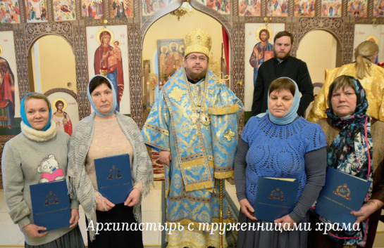
Архиепастырь с труженницами храма