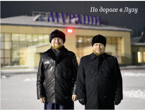
По дороге в Лузу