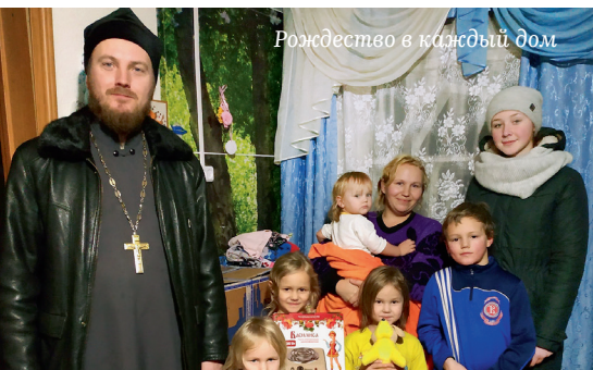
Рождество в каждый дом