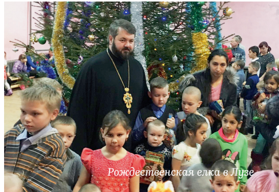
Рождественская елка в Лузе