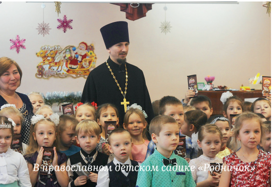
В православном детском садике «Родничок»