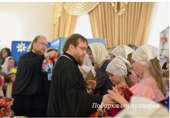
Подарки от архиерея