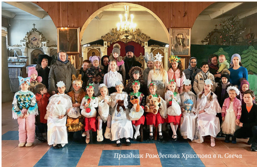
Праздник Рождества Христова в п. Свеча