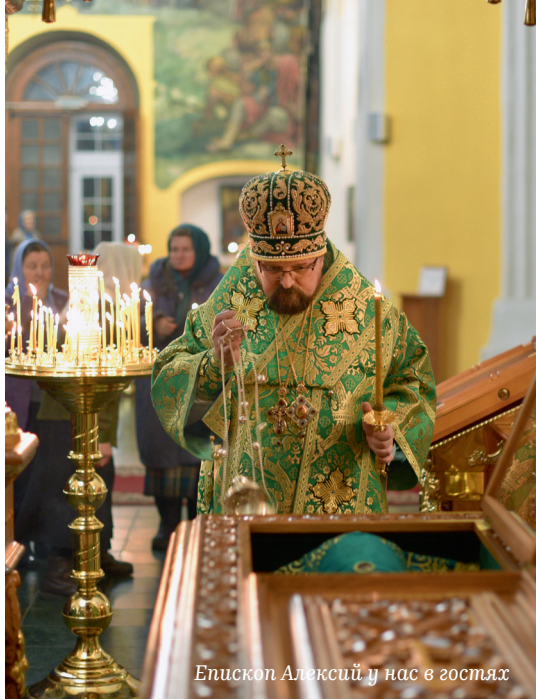
Епископ Алексий у нас в гостях