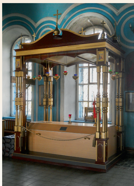
Место погребения Владыки в Никольском соборе г. Котельнича

Евангелия), сделали хорошо; когда они единолично стали откалываться – поступили неправильно, дерзновенно взяв на себя одних решение общецерковного вопроса. Они повторили ошибку митрополита Сергия. [...] Объявить преждевременный разрыв с Предстоятелем или уклониться от участия в церковном управлении, уйти на покой – это значит оставить свою паству во время бедствия Церкви, отойти в сторону, уступая место противнику, – лишь бы не запачкать своих чистых одежд среди общего смятения и утешать себя тем, что мы не причастны греху Предстоятеля. Но ведь мы тем совершаем грех бесчувствия в скорбях и страданиях св. Церкви, тогда как ответственность за церковную жизнь с нас не снимается». Мы знаем ряд архипастырей, которые ушли в предельно жесткую оппозицию к митрополиту Сергию, создали целые церковные течения. Их позицию наша Церковь тоже признала, но лично мне близок выбор братьев-епископов Кедровых.